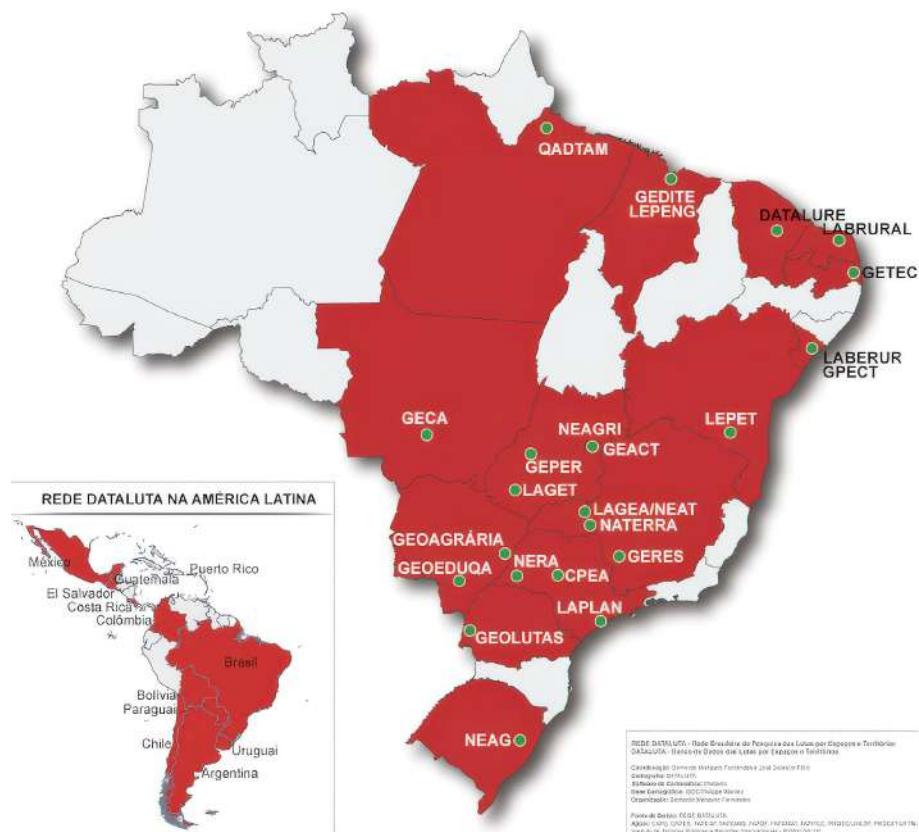
Espacialização da Rede Dataluta - 2025

Durante esse período de vinte e cinco anos, a Rede Daluta estabeleceu-se como um Coletivo de Pensamento focado na construção de um Estilo de Pensamento, 6 ou seja, um conjunto de métodos e metodologias para a construção conceitual e a reconceitualização a partir do debate paradigmático, no sentido de ter uma postura teórica bem definida. O uso do debate paradigmático como estilo de pensamento nos permitiu aprofundar nossas leituras sobre as principais referências do paradigma da questão agrária e do paradigma do capitalismo agrário (Fernandes, 2013b). Esse estilo possibilita compreender melhor as conflitualidades entre campesinato e agronegócio nas disputas territoriais, inclusive no que tange aos modelos de desenvolvimento.